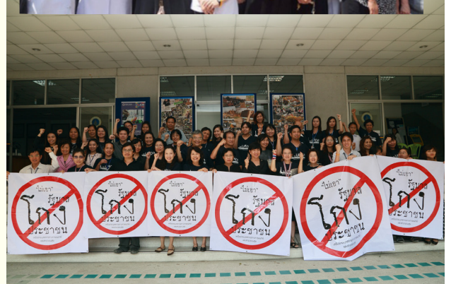
กลุ่มบุคคลชาวคณะแพทยศาสตร์ศิริราชพยาบาล คณะแพทยศาสตร์โรงพยาบาลรามาธิบดี และคณะวิทยาศาสตร์ได้รวมตัวกันตามวิทยาเขตต่าง ๆ เพื่อแสดงจุดยืนต่อต้านไม่เอารัฐบาลที่โกงประชาชน